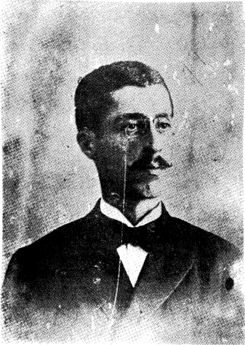
الامير شكيب في الخامسة والعشرين من عمره - كانون الثاني ١٨٩٥